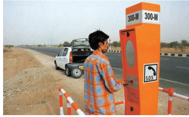
चित्र 7.10 – राष्ट्रीय राजमार्ग-8 पर एक आपातकालीन कॉल बॉक्स

डिजिटल भारत एक ज्ञान आधारित परिवर्तन के लिए, भारत को तैयार करने के लिए एक विशाल कार्यक्रम है। डिजिटल भारत कार्यक्रम का मुख्य उद्देश्य IT (भारतीय प्रतिभा) +IT (सूचना प्रौद्योगिकी)=IT (कल का भारत) में होने वाले परिवर्तन को समझना है और तकनीक को केन्द्र में रखकर बदलाव लाना है।