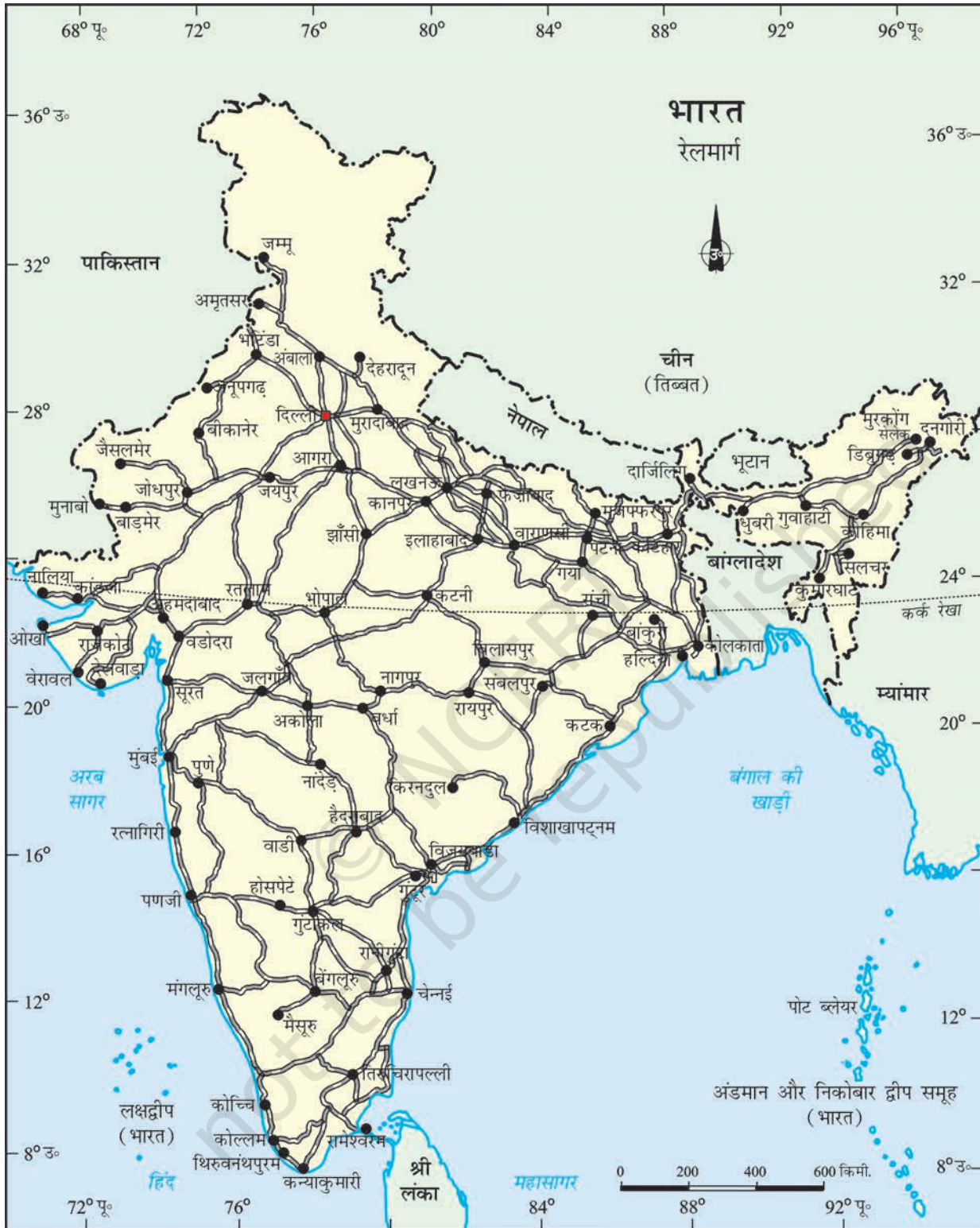
भारत - रेलमार्ग