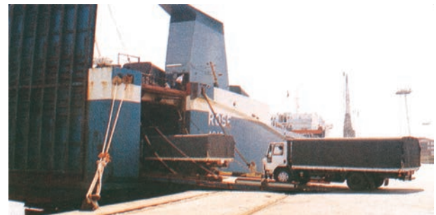
चित्र 7.6 – मुंबई पत्तन में जहाज पर ट्रकों को ले जाते हुए

मुंबई वृहत्तम पत्तन है जिसके प्राकृतिक खुले, विस्तृत व सुचारु पोताश्रय हैं। मुंबई पत्तन के अधिक परिवहन को ध्यान में रखकर इसके सामने जवाहरलाल नेहरू पत्तन विकसित किया गया जो इस पूरे क्षेत्र को एक समूह