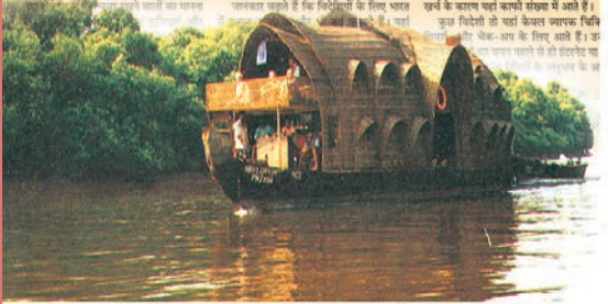
गोआ के मैंग्रोव वन में पारि-पर्यटन

का अनुमान लगाया होटलों के साथ करार हुआ है और केरल और महाराष्ट्र जैसे पर्यटन के विकास में अग्रणी राज्यों पर अन्य राज्यों की तुलना में अग्रणी राज्यों में विदेशियों की संख्या के साथ करार हुआ है। अग्रणी राज्यों में विदेशियों की संख्या के साथ करार हुआ है। अग्रणी राज्यों में विदेशियों की संख्या के साथ करार हुआ है। अग्रणी राज्यों में विदेशियों की संख्या के साथ करार हुआ है।