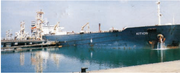
चित्र 7.7 – न्यू-मंगलौर पत्तन पर टैंकर द्वारा कच्चे तेल का निर्वहन

पत्तन की सुविधा भी प्रदान कर सके। लौह-अयस्क के निर्यात के संदर्भ में मारमागाओ पत्तन देश का महत्वपूर्ण पत्तन है। यहाँ से देश के कुल निर्यात का आधा (50 प्रतिशत) लौह-अयस्क निर्यात किया जाता है। कर्नाटक में स्थित न्यू-मैंगलोर पत्तन कुद्रेमुख खानों से निकले लौह-अयस्क का निर्यात करता है। सुदूर दक्षिण-पश्चिम में कोची पत्तन है; यह एक लैगून के मुहाने पर स्थित एक प्राकृतिक पोताश्रय है।