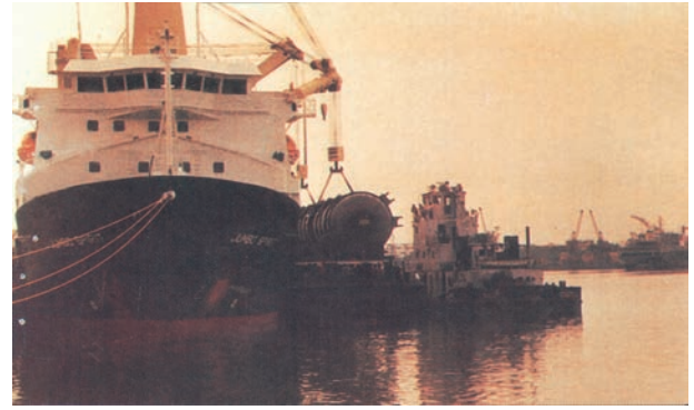
चित्र 7.8 – बड़े आकार के कार्गो को उताने-रखने की सुविधाओं से युक्त तूतीकोरन पत्तन

पूर्वी तट के साथ तमिलनाडु में दक्षिण-पूर्वी छोर पर तूतीकोरन पत्तन है। यह एक प्राकृतिक पोताश्रय है तथा इसकी पृष्ठभूमि भी अत्यंत समृद्ध है। अतः यह पत्तन हमारे पड़ोसी देशों जैसे – श्रीलंका, मालदीव आदि तथा भारत के तटीय क्षेत्रों की भिन्न वस्तुओं के व्यापार को संचालित करता है। चेन्नई हमारे देश का प्राचीनतम कृत्रिम पत्तन है। व्यापार की मात्रा तथा लदे सामान के संदर्भ में इसका मुंबई के बाद दूसरा स्थान है। विशाखापट्टनम स्थल से घिरा, गहरा व सुरक्षित पत्तन है। प्रारम्भ में यह पत्तन लौह-अयस्क निर्यातक के रूप में विकसित किया गया था। ओडिशा में स्थित पारादीप पत्तन विशेषतः लौह-अयस्क का निर्यात करता है। कोलकाता एक अंतःस्थलीय नदीय (Riverine) पत्तन है। यह पत्तन गंगा-ब्रह्मपुत्र बेसिन के वृहत् व समृद्ध पृष्ठभूमि को सेवाएँ प्रदान करता है। ज्वारीय (Tidal) पत्तन होने के कारण तथा हुगली के तलछट जमाव से इसे नियमित रूप से साफ करना पड़ता है। कोलकाता पत्तन पर बढ़ते व्यापार को कम करने हेतु हल्दिया सहायक पत्तन के रूप में विकसित किया गया है।