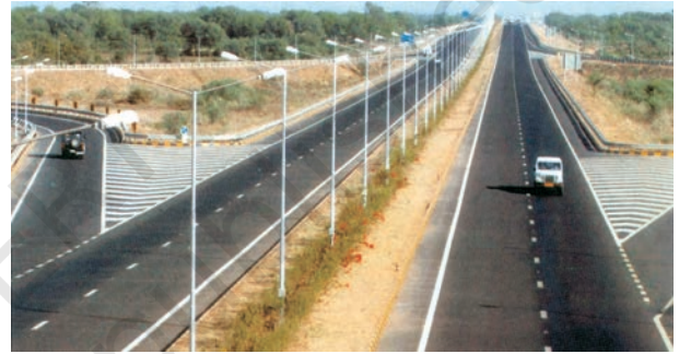
चित्र 7.1 – अहमदाबाद-वडोदरा द्रुतमार्ग