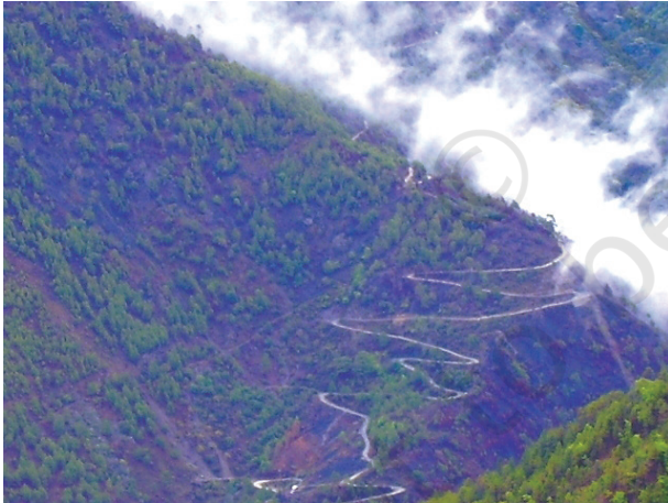
चित्र 7.3 – पहाड़ी रास्ते