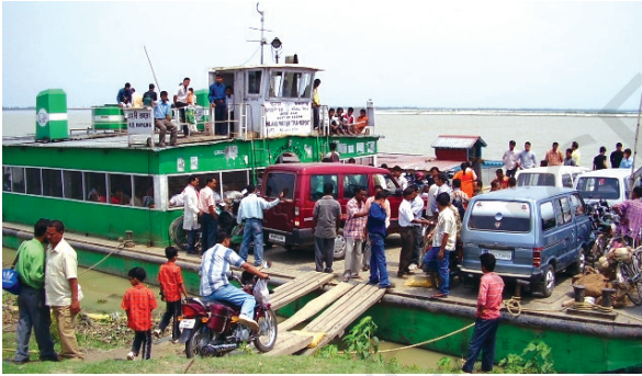
चित्र 7.5 – उत्तर-पूर्वी राज्यों में आंतरिक जलमार्ग परिवहन अधिक महत्वपूर्ण है

भारत के लोग प्राचीनकाल से समुद्री यात्राएँ करते रहे हैं। इसके नाविकों ने दूर तथा पास के क्षेत्रों में भारतीय संस्कृति व व्यापार को फैलाया है। जल परिवहन, परिवहन का सबसे सस्ता साधन है। यह भारी व स्थूलकाय वस्तुएँ ढोने में अनुकूल है। यह परिवहन साधनों में ऊर्जा सक्षम तथा पर्यावरण अनुकूल हैं। भारत में अंतः स्थलीय नौसंचालन जलमार्ग 14,500 किमी. लंबा है। इसमें केवल 5,685 किमी. मार्ग ही मशीनीकृत नौकाओं द्वारा तय किया जाता है।