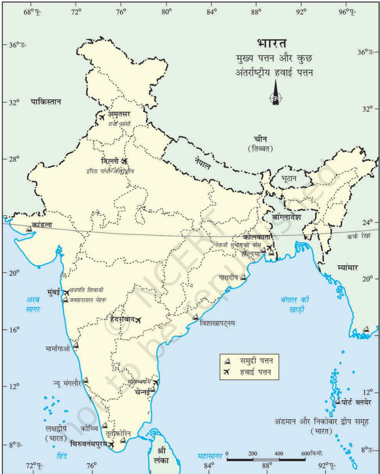
भारत - मुख्य पत्तन और कुछ अंतर्राष्ट्रीय हवाई पत्तन