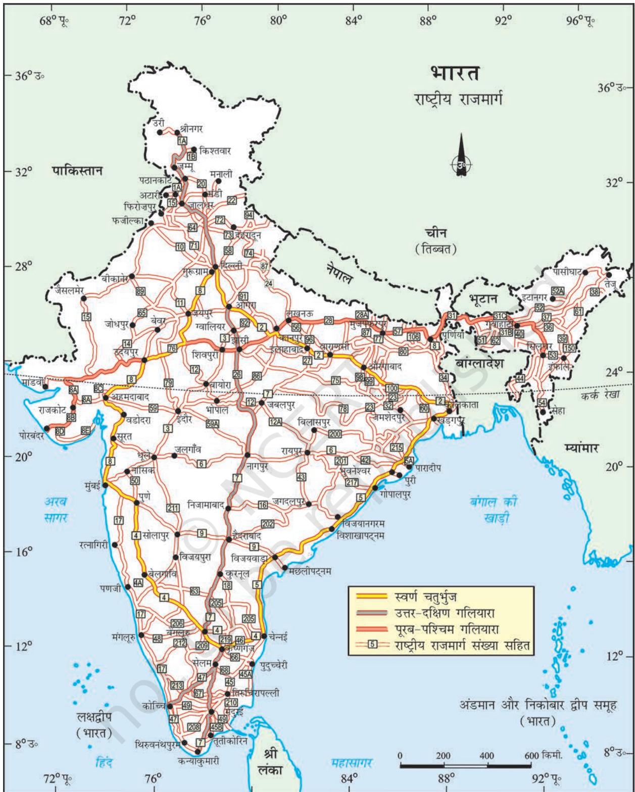
भारत - राष्ट्रीय राजमार्ग