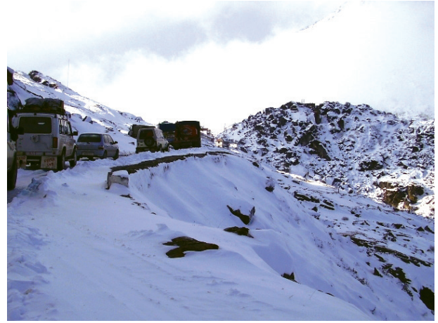
चित्र 7.4 – उत्तरी-पूर्वी सीमा सड़क पर यातायात (अरुणाचल प्रदेश)